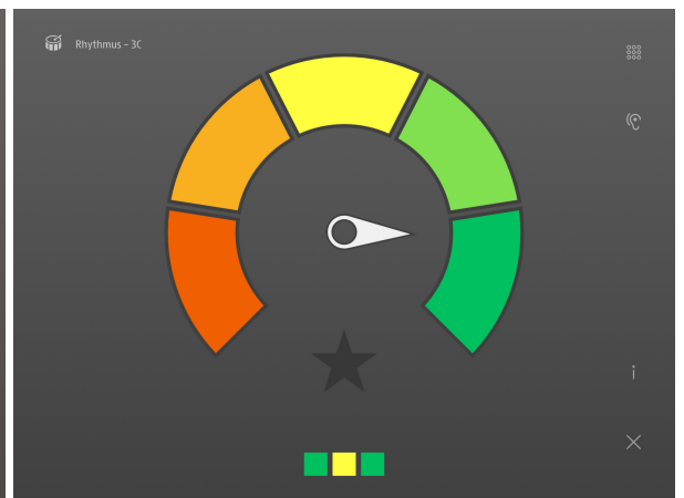
Zum Schluss wird die Übung bewertet. Die Bewertung wird ins Lernjournal übernommen.