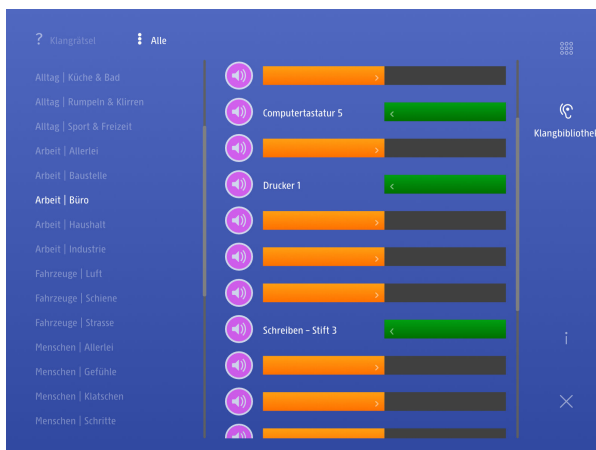
Stöbern in der Klangbibliothek: Klänge hören und dann nachschauen, was sich in den Schubladen verbirgt.