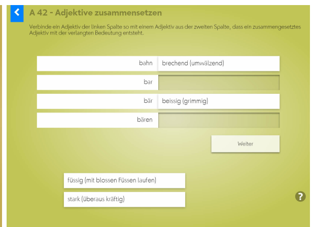
Das Zusammensetzen von Adjektiven macht Spass.