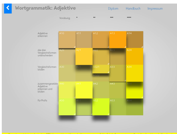
Die Hauptsteuerseite zeigt die Themen. Die «Höhe» der Kacheln stellt den Bearbeitungsstand dar.