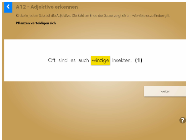
Das Erkennen von Adjektiven wird geübt. Die Zahl (1) gibt die Anzahl der gesuchten Adjektive an.