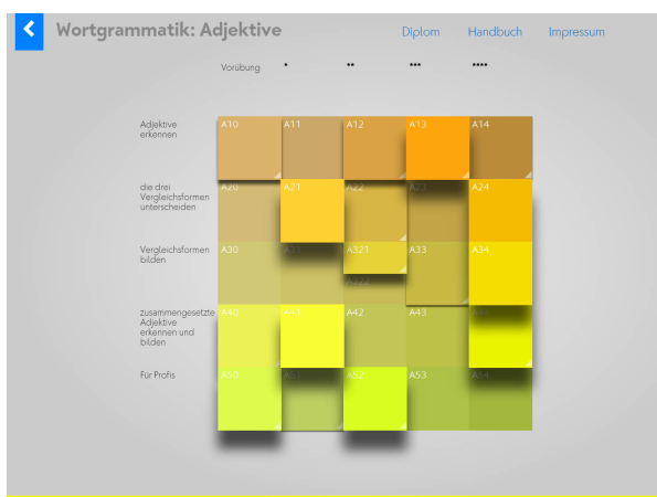
Die Hauptsteuerseite zeigt die Themen. Die «Höhe» der Kacheln stellt den Bearbeitungsstand dar.